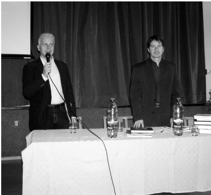
Pohľad na prednášajúcich

Poukazuje na množstvo obetí, ktoré zo sebou priniesli. Je to naozaj hodnotný film, ktorý odкрýva doteraz nám skryté skutočnosti pri upevňovaní komunistickej ideológie vo vtedajšom Sovietskom zväze.