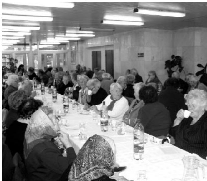
Foto: Seniori pri spoločenskom posedení

V mene vedenia mesta, poslancov a všetkých občanov, prajeme našim starým veľa zdravia, sily a lásky. Nech sú ešte dlho medzi nami šťastní a spokojní.